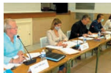
Conseil municipal du 22 septembre 2021.