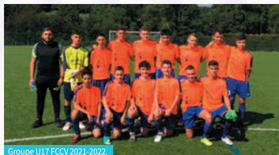
Groupe U17 FCCV 2021-2022.

En cette rentrée 2021, le foot a repris au stade de la Gérifondière. Avec plus de 228 licenciés, le Football Club du Canton de Vinay accueille toutes les catégories de U6 à vétérans. 24 éducateurs bénévoles assurent l'encadrement et les entraînements en semaine puis les matchs le week-end. C'est aussi une équipe dirigeante bénévole de 10 personnes qui permet au club de fonctionner correctement tout au long de l'année. Dans le district de l'Isère, le FCCV en compétition, c'est 1 équipe Seniors, 1 équipe Vétérans, 1 équipe U17, 1 équipe U15, 3 équipes U13 et une 4 ème en entente avec le club du Versau. En animation, c'est 1 équipe dans les catégories U11, U10, U8, 2 équipes en U9 et un groupe U6/U7.