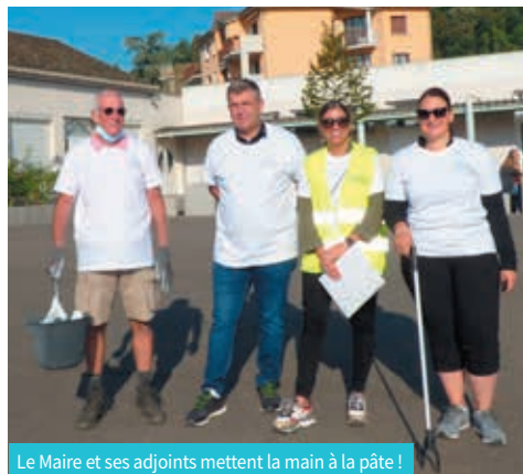
Le Maire et ses adjoints mettent la main à la pâte !