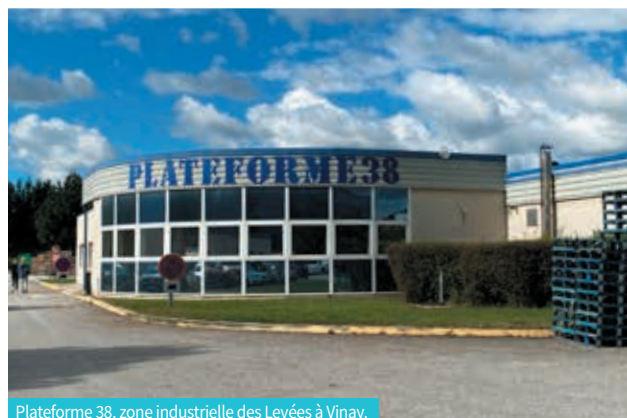
Plateforme 38, zone industrielle des Levées à Vinay.