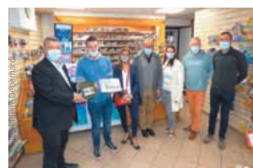
Nouveau propriétaire du bureau de tabac.