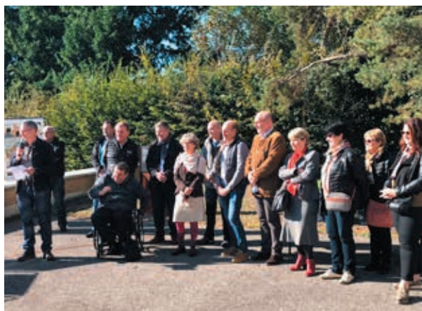
Marché du Terroir gourmand au grand séchoir, 17 octobre 2021.