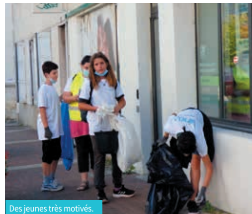
Des jeunes très motivés.

Le 18 septembre, collégiens, membres du Conseil municipal enfants, élus et bénévoles motivés ont retroussé leurs manches pour nettoyer les rues de Vinay. Au total, 120 nettoyeurs qui n'ont pas épargné leurs efforts sur les 21 circuits proposés par le club Éco-citoyens du collège pour un résultat spectaculaire. 1 000 litres de sacs poubelles "tout venant", 800 litres de plastique, 700 litres de métal et cannettes, 15 litres d'objets en verre... Et 13 300 mégots de cigarettes ramassés !