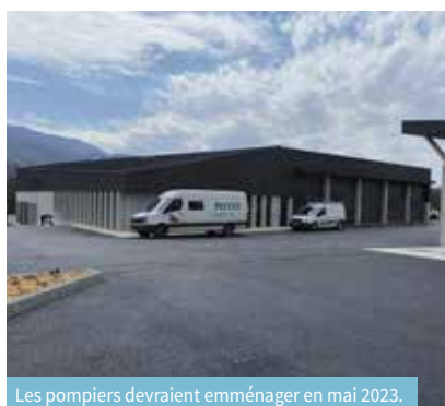
Les pompiers devraient emménager en mai 2023.

LE GYMNASE Le chantier prévoit deux phases : la réfection du gymnase existant et la construction d'une extension pour laquelle les fondations sont prêtes. Le chantier de construction en est au gros oeuvre. Depuis peu, le gymnase existant a fermé ses portes pour permettre le lancement des travaux de rénovation. Ceux-ci doivent s'achever à l'automne. L'extension devrait quant à elle être livrée en février 2024.