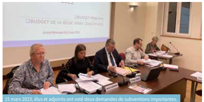
15 mars 2023, élus et adjoints ont voté deux demandes de subventions importantes.

Pour mener à bien ses projets d'utilité publique et d'économie d'énergie, la Ville de Vinay sait pouvoir compter sur des partenaires comme l'État, le Département ou la Région. Récemment, les élus du Conseil municipal ont voté deux demandes importantes de subvention. La première s'adressait à l'État via le Fonds Vert proposé par le ministère de la Transition écologique et concerne le remplacement de 83 % de l'éclairage public de la ville en LED d'ici à la fin de l'année (les 17 % restants ayant déjà été remplacés). Après avoir acté l'extinction de l'éclairage entre minuit et 5h du matin, les élus souhaitaient aller plus loin. Le passage aux LEDs permettra de diminuer d'une part très fortement la consommation d'électricité et d'autre part les frais de maintenance et d'entretien du parc d'éclairage public. L'investissement nécessaire s'élève à environ 460 000 € pour l'ensemble des luminaires. La seconde demande importante concerne la construction de la future école de la Mayette 2 à proximité immédiate de la Mayette 1. Le projet prévoit la construction d'un bâti-