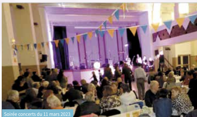
Soirée concerts du 11 mars 2023

Le 11 mars, LEZ'Arts en Fête a proposé une nouvelle fois une soirée musicale conviviale et joyeuse. Près de 250 personnes ont pu écouter, chanter et danser au rythme endiablé des créations du groupe de Chatte « On s'serre les coudes » et les reprises du groupe « The Comments ».