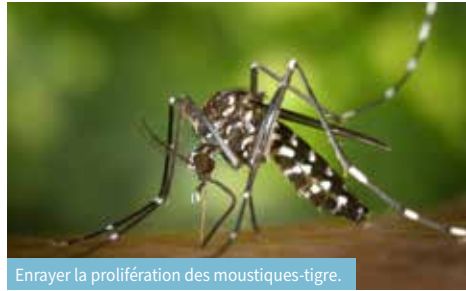
Enrayer la prolifération des moustiques-tigre.