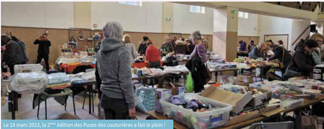
Le 18 mars 2023, la 2 ème édition des Puces des couturières a fait le plein !

La 2 ème édition des Puces des couturières du club Patchalanoix a été un succès, aussi bien du côté des exposants que des visiteurs. Les membres du club ont largement contribué à cette dynamique qui a demandé 4 mois de préparation. L'association vous donne rendez-vous l'année prochaine pour la troisième édition !