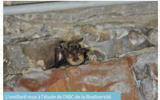
L'oreillard roux à l'étude de l'ABC de la Biodiversité.

L'ABC poursuit un objectif non seulement scientifique mais aussi citoyen, éducatif et écologique. Il est impulsé par une collectivité, mais a besoin de la participation de la population. L'ABC doit être rendu en septembre, il est encore temps de partager vos données ! Vous avez peut-être sur votre propriété un arbre remarquable, une zone humide, aussi petite soit-elle, ou des chauve-souris qui nichent derrière votre volet. On a besoin que vous les signaliez et pour cela, le Parc Naturel Régional du Vercors propose une carte interactive sur laquelle il est facile de signaler vos découvertes avec l'observatoire participatif de la biodiversité. Vous y accédez en scannant le code QR ci-contre. La création d'un compte est facultative, mais vous permettra d'accéder à votre espace personnel afin de modifier ou exporter vos observations. Mais