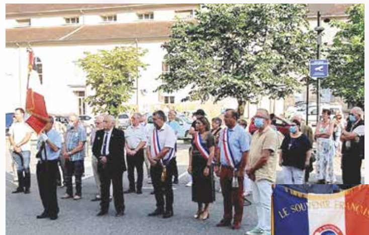
18 juin 2021, le Souvenir Français présent pour la commémoration de l'Appel du Général De Gaulle.

Contact : Yves Gauzentes / 06 88 75 11 51