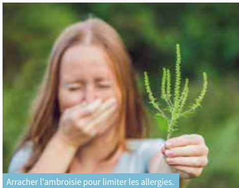
Arracher l'ambrosie pour limiter les allergies.

local a laissé place au moustique-tigre, plus petit, mais beaucoup plus agressif. Comment lutter contre cet insecte ? Il faut savoir avant toute chose que les moustiques pondent généralement dans des réserves d'eau stagnante et à plus de 15°. Nous vous conseillons de vider les coupelles d'eau sous vos plantes et de rendre étanches vos réservoirs d'eau afin de ne pas les attirer. Il existe plusieurs répulsifs naturels tels que le citron, le clou de girofle, l'eucalyptus, la menthe poivrée ou la lavande. Sachez également que les chauves-souris sont les principaux prédateurs des moustiques, préservons donc ces animaux ainsi que leurs abris.