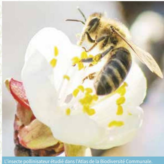
L'insecte pollinisateur étudié dans l'Atlas de la Biodiversité Communale.

Préserver la biodiversité est essentiel et pour bien la préserver, il faut bien la connaître. Conscients de cet enjeu, les élus de Vinay ont répondu à l'appel du Parc Naturel Régional du Vercors pour élaborer son Atlas de la Biodiversité Communale. Il s'agit de dresser un inventaire des milieux et espèces présents sur notre territoire. Il implique tout le monde : élus, citoyens, associations, entreprises... en faveur de la préservation du patrimoine naturel. Plus qu'un simple inventaire, un ABC est un outil d'aide à la décision pour les collectivités, il facilite l'intégration des enjeux forts de la biodiversité dans leurs politiques locales. En tant qu'habitant,