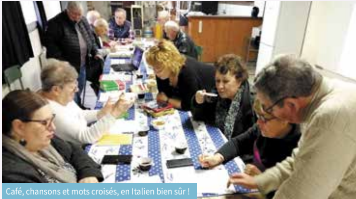
Café, chansons et mots croisés, en Italien bien sûr !