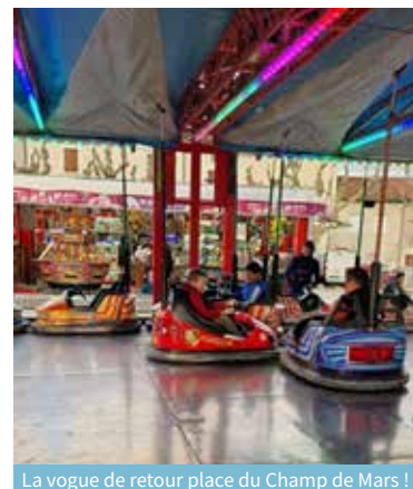
La vogue de retour place du Champ de Mars !