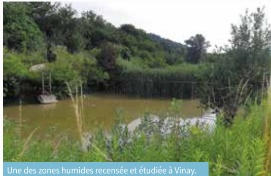
Une des zones humides recensées et étudiées à Vinay.

" Avec cette démarche, nous sommes agréablement surpris par la richesse de la biodiversité présente à Vinay. La Nature peut être résiliente pour peu que nous lui en laissons le temps. Notre projet intègre des Vinois motivés, différentes associations du territoire et des professionnels de la nuciculture. Nous pouvons encore être plus nombreux pour cette dernière ligne droite avant la publication de notre ABC !"