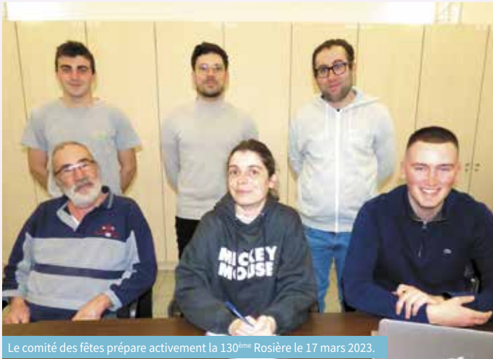
Le comité des fêtes prépare activement la 130 ème Rosière le 17 mars 2023.