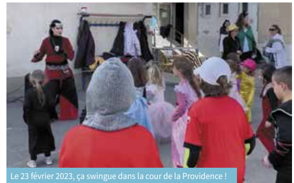
Le 23 février 2023, ça swingue dans la cour de la Providence !

Les festivités ont débuté le 23 février avec le carnaval organisé par l'école de la Providence, le jour de Mardi gras. Les 125 enfants de l'école de la Providence ont déambulé par petit groupe entre une douzaine d'ateliers animés par des membres de l'équipe et de parents d'élèves. Le carnaval de la