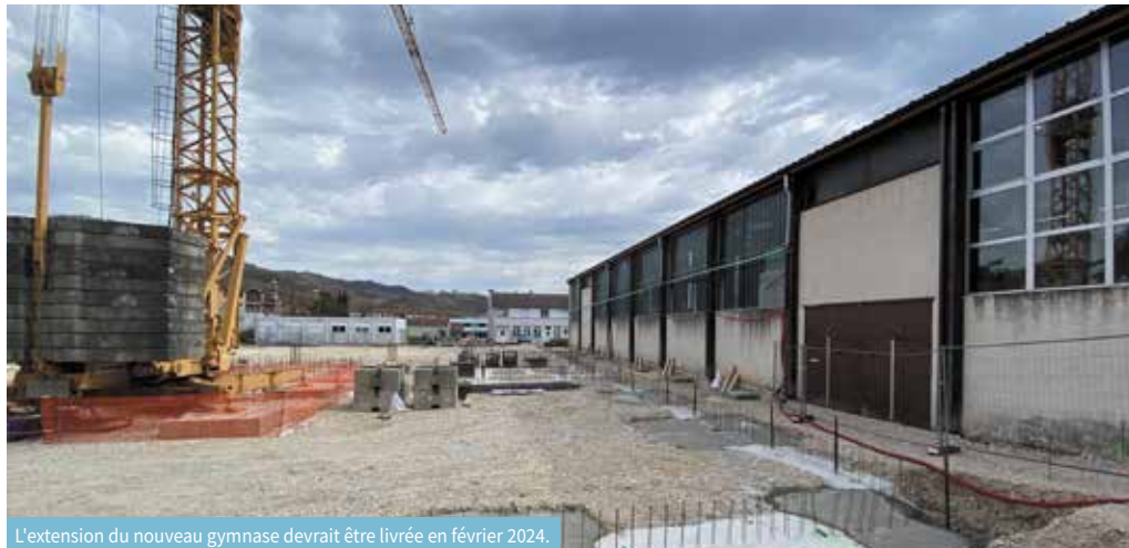
L'extension du nouveau gymnase devrait être livrée en février 2024.