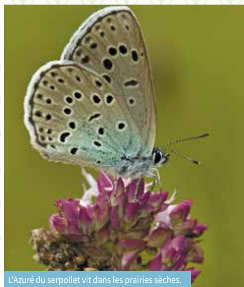
L'Azuré du serpolet vit dans les prairies sèches.

L'Atlas de la Biodiversité Communale mené à Vinay a notamment déjà permis de révéler la présence de trois espèces de papillons classées en grand danger d'extinction. Le premier : le Damier de la succise qui vit dans les zones humides, le second est la Bacchante que l'on trouve plutôt à la lisière des forêts. Enfin, la troisième espèce repérée est l'Azuré du serpolet. La femelle pond ses œufs sur une plante hôte (serpolet), à proximité d'une fourmi hôte (myrmica sabuleti). La chenille se nourrit des fleurs de la plante jusqu'à sa troisième mue puis elle se laisse tomber au sol. Elle sécrète alors des molécules très proches de celles des larves de fourmi favorisant ainsi son adoption par ces dernières qui la transportent dans la fourmilière. Après avoir été protégée et s'être nourrie de couvain, la larve devenue papillon n'a plus qu'à prendre son envol !