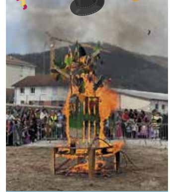
Les derniers instants de M. Carnaval !