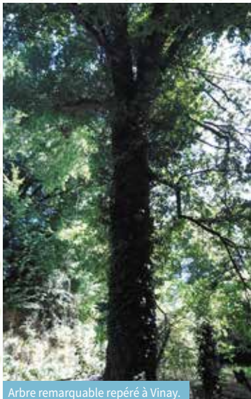
Arbre remarquable repéré à Vinay.

d'observation : les chauves-souris, les pollinisateurs, les arbres remarquables et les zones humides.