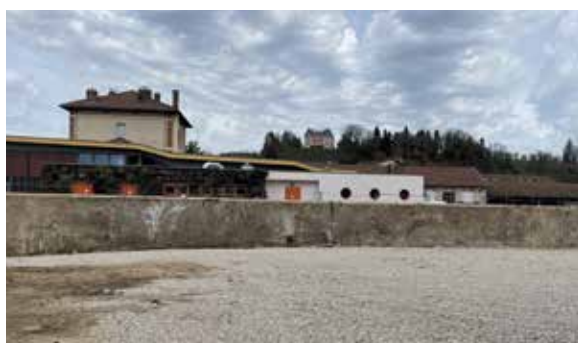
Les travaux préparatoires de la nouvelle Mayette 2 ont débuté cette année.