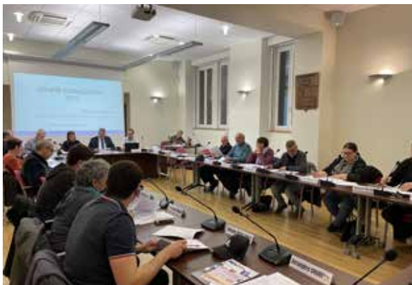
Le 15 mars, le Conseil municipal de Vinay planche sur le compte administratif.