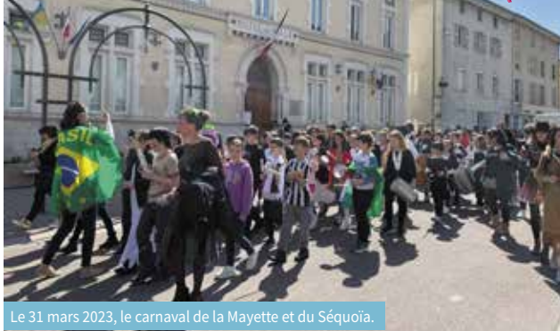
Le 31 mars 2023, le carnaval de la Mayette et du Séquoïa.