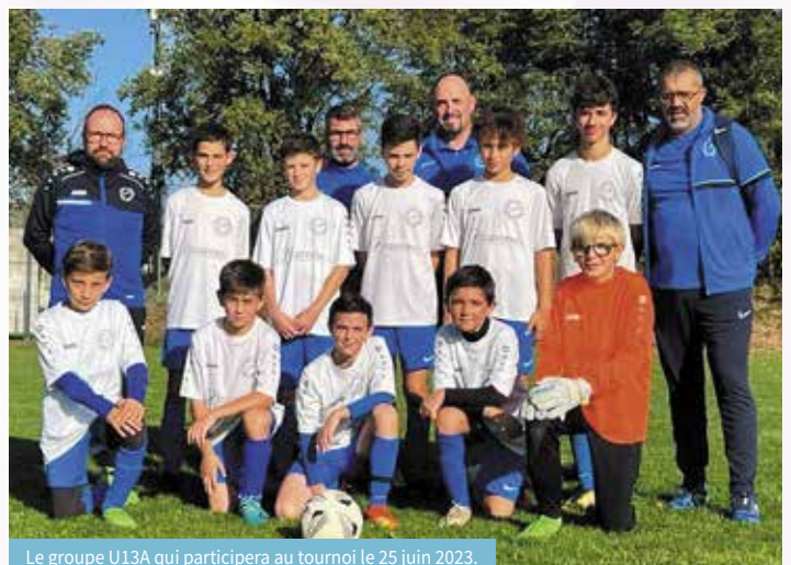
Le groupe U13A qui participera au tournoi le 25 juin 2023.

vacances scolaires du 17 au 21 Avril. Puis, un tournoi de football U13 qui rassemblera 16 équipes de la région Rhône-Alpes, le samedi 25 Juin. Contact : fccv38470@gmail.com