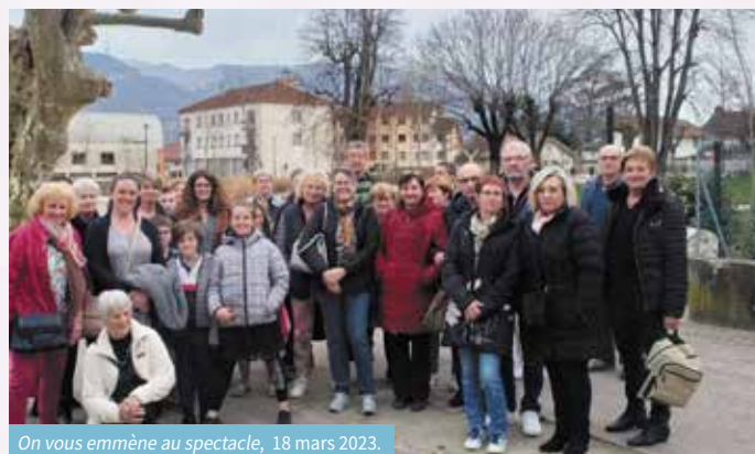
On vous emmène au spectacle, 18 mars 2023.

La saison 2022-2023 de l'action « On vous emmène au spectacle » s'est terminée pour 43 de nos concitoyens samedi 18 mars à la Maison de la Danse à Lyon où la Cie la Machine de cirque a présenté un spectacle époustouflant de prouesses acrobatiques tout en jouant sur la corde de l'humour.