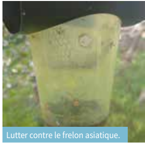
Lutter contre le frelon asiatique.

Le printemps arrive avec ses beaux jours, mais aussi avec les tracas que la nature veut bien nous apporter. Nous avons répertorié plusieurs nuisances invasives sur lesquelles il nous semblait indispensable de communiquer.