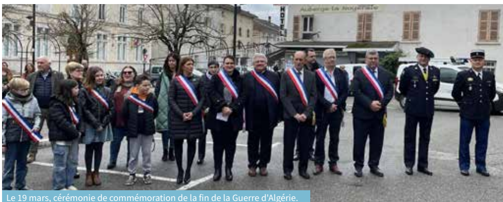
Le 19 mars, cérémonie de commémoration de la fin de la Guerre d'Algérie.

Certifiée Imprim'Vert Imprimé sur papier recyclé.