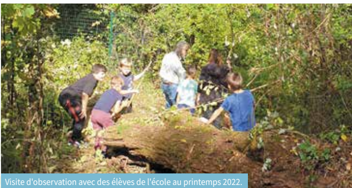
Visite d'observation avec des élèves de l'école au printemps 2022.

L'OBSERVATOIRE PARTICIPATIF DE LA BIODIVERSITÉ PARTAGEZ VOS OBSERVATIONS ET AIDEZ-NOUS À PRÉSERVER LA BIODIVERSITÉ !