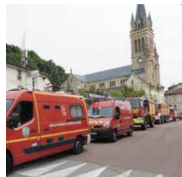
Les pompiers viennent d'intégrer leur nouvelle caserne ! Samedi 1 er juillet, l'ensemble des véhicules ont traversé le centre ville de l'ancienne caserne en direction de la Montée de Trellins.