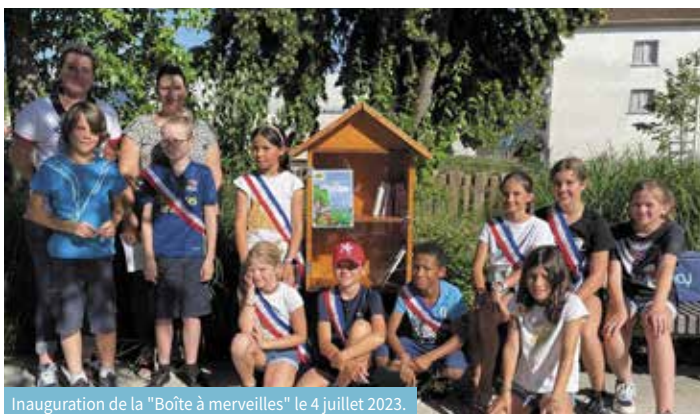
Inauguration de la "Boîte à merveilles" le 4 juillet 2023.