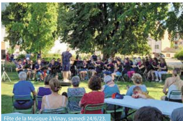
Fête de la Musique à Vinay, samedi 24/6/23.

Certifiée Imprim'Vert Imprimé sur papier recyclé.