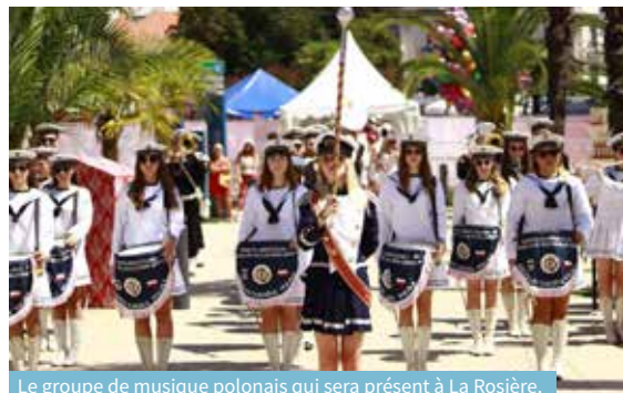
Le groupe de musique polonais qui sera présent à La Rosière.

Après le succès de l'an dernier, c'était une réelle demande du jeune public de faire appel au même DJ, pour un tout nouveau show !