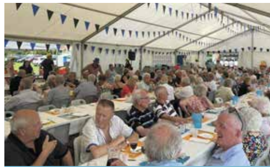
280 Aînés vinois se sont retrouvés avec plaisir au stade de rugby.