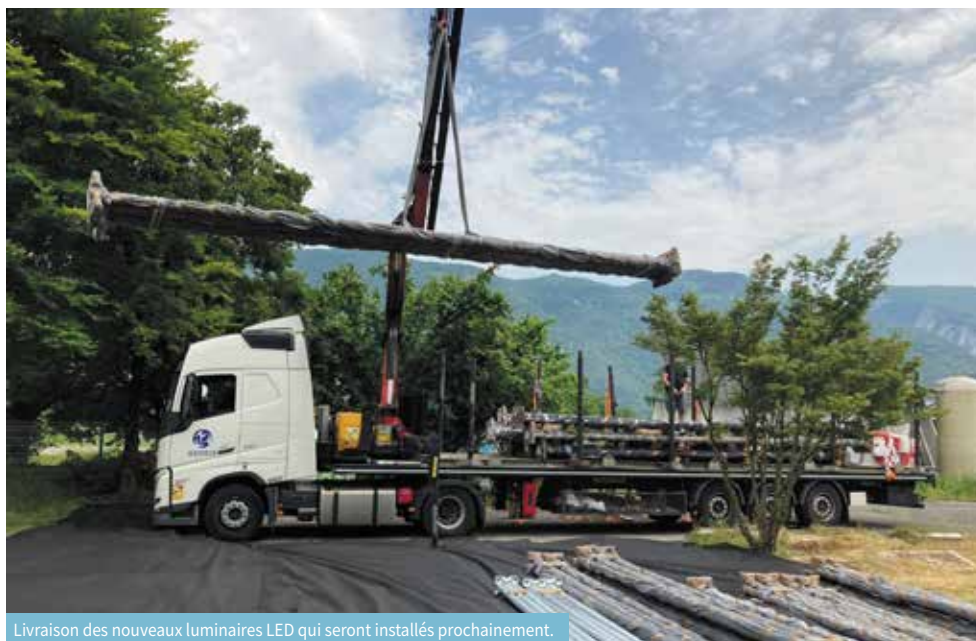
Livraison des nouveaux luminaires LED qui seront installés prochainement.

17 % de l'éclairage public actuel en LED. Ce sera 100% d'ici à la fin de l'année !