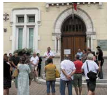
Appel contre les incivilités envers les élus, 3/7/23.