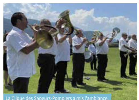
La Clique des Sapeurs-Pompiers a mis l'ambiance.