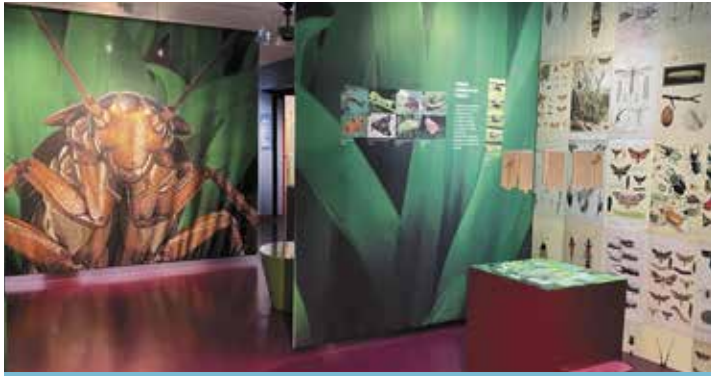
L'exposition Parlez-moi d'insectes est accessible au Grand Séchoir jusqu'au 31 décembre 2024.

Les insectes sont à l'honneur au Grand Séchoir ! C'est le sujet de la nouvelle exposition temporaire et le thème autour duquel les nombreuses animations d'été du Grand Séchoir tourneront. L'exposition Parlez-moi d'insectes permet de découvrir leur diversité, mais aussi d'interroger les relations qu'entretiennent les humains avec ces petites bêtes... Elles sont essentielles car garantes du bon équilibre et du dynamisme des écosystèmes. Certaines espèces rendent d'immenses services écologiques. Les préserver est donc primordial : pour le travail qu'elles produisent, mais aussi pour l'émerveillement qu'elles procurent pour peu qu'on prenne le temps de les observer. Pourtant, aujourd'hui, on entend que 80% des insectes ont disparu... Vous trouverez à l'exposition une collection d'insectes prêtée par le club entomolo-