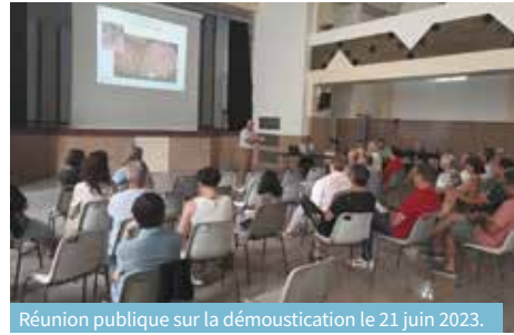
Réunion publique sur la démoustication le 21 juin 2023.

Pour répondre aux inquiétudes des Vinois concernant la prolifération des moustiques, les élus de la Ville ont organisé une