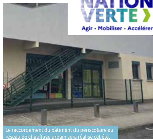
Le raccordement du bâtiment du périscolaire au réseau de chauffage urbain sera réalisé cet été.

Le passage aux LED permettra à la Ville de diviser par 4 les consommations énergétiques de son éclairage public. D'autres mesures concrètes sont en cours ou à la réflexion pour réduire encore plus la facture et notamment le passage aux LED pour éclairer l'ensemble des bâtiments publics. Le raccordement du bâtiment du périscolaire au chauffage urbain sera réalisé cet été. Enfin, le nouveau gymnase a bénéficié d'une rénovation thermique pour améliorer sa performance énergétique. À la Mairie, les élus et les services peuvent compter sur l'expertise d'Amaury Gaude dont le travail consiste à rechercher toutes mesures, plus ou moins importantes pour réduire les coûts d'énergie sur le moyen et le long terme et agir ainsi et par la même occasion sur la protection de l'environnement.