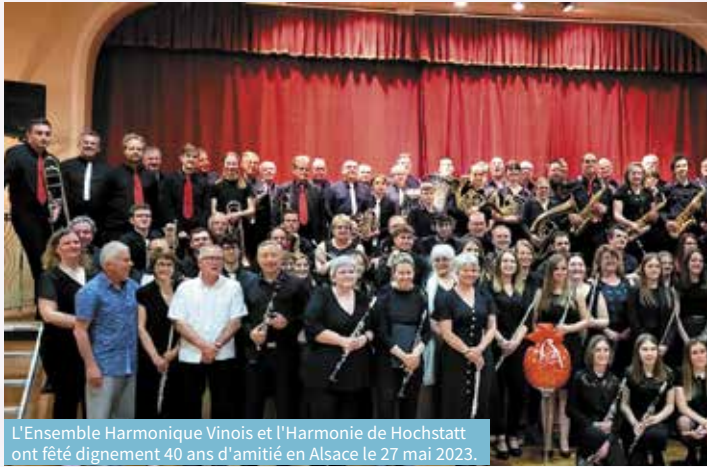
L'Ensemble Harmonique Vinois et l'Harmonie de Hochstatt ont fêté dignement 40 ans d'amitié en Alsace le 27 mai 2023.