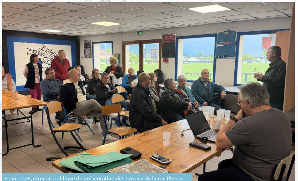
5 mai 2026, réunion publique de présentation des travaux de la rue Plossu.

Une réunion publique s'est tenue le mardi 12 mai afin de présenter le projet et le calendrier des travaux aux riverains.