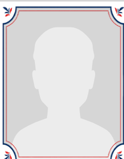
Frédéric Penin conseiller municipal