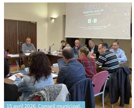
15 avril 2026, Conseil municipal.