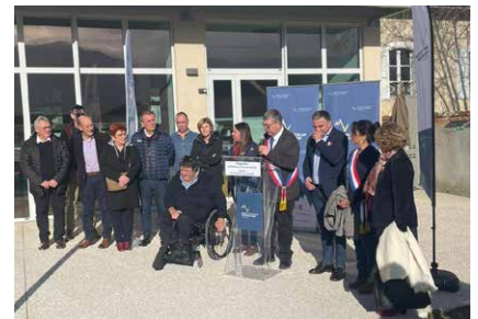
La médiathèque intercommunale a été inaugurée le 16 janvier 2026.