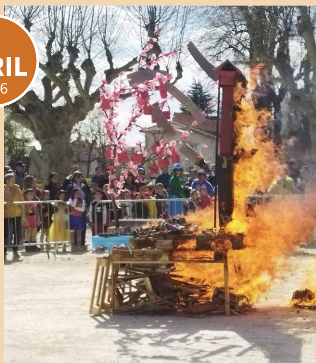
3 avril 2026 Le carnaval des écoles publiques a réuni plus de 400 élèves en présence des enseignants, des équipes périscolaires et de nombreux parents.