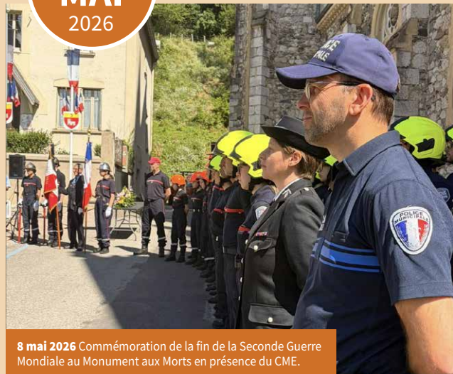
8 mai 2026 Commémoration de la fin de la Seconde Guerre Mondiale au Monument aux Morts en présence du CME.