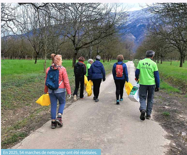
En 2025, 54 marches de nettoyage ont été réalisées.

Depuis trois ans, le CMI-Vinay et ses groupes de marche nordique mènent une action citoyenne baptisée « Marche verte ». Le principe : allier activité physique et protection de l'environnement grâce au ramassage des déchets le long des rues, chemins et sentiers de Vinay et de Portes du Vercors. Les bénévoles ont déjà parcouru une vingtaine de communes, avec une attention particulière portée à Vinay. En parallèle, le club participe aussi à l'arrachage de l'ambrosie et au balisage des sentiers de randonnée, en lien avec la Fédération de randonnée et le Parc du Vercors. En 2025, 54 sorties ont été réalisées, soit plus d'une par semaine. Le club fournit l'ensemble du matériel : gants, pinces, sacs, tenues visibles et déplacements. Après chaque collecte, les déchets sont triés et recyclés lorsque cela est possible. Le bilan 2025 représente 6 740 litres de déchets ramassés : mégots, canettes, bouteilles en verre, plastiques, emballages ou ferraille. Depuis le lancement de l'opération, plus de 30 000 canettes et 15 000 bouteilles en verre ont ainsi été retirées de la nature.