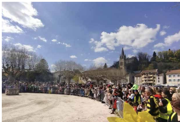
3 avril, carnaval des écoles publiques « Vers un monde meilleur » au rythme de la batucada accompagnée de Monsieur Carnaval.