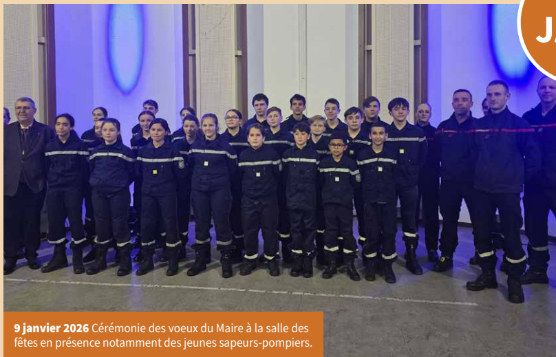
9 janvier 2026 Cérémonie des vœux du Maire à la salle des fêtes en présence notamment des jeunes sapeurs-pompiers.