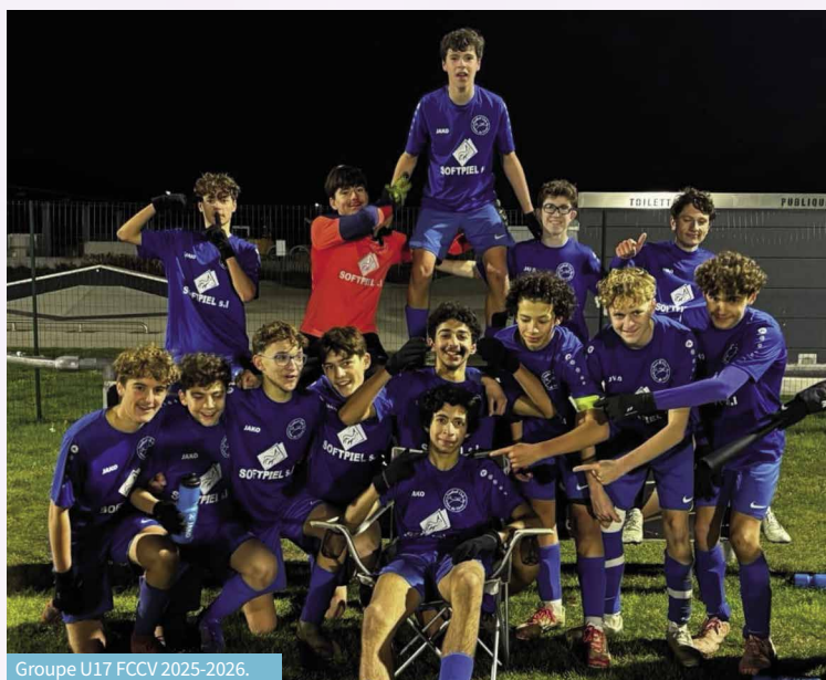
Groupe U17 FCCV 2025-2026.

Le FCCV clôture sa saison avec deux rendez-vous importants : la rencontre avec ses partenaires le 29 mai au siège du club, puis l'assemblée générale le 5 juin à 19h au stade de la Gérifondrière. En avril, le club a organisé un stage U10/U13 réunissant une trentaine d'enfants, ainsi que des formations éducateurs (CFI U8/U9 et U14/U19) accueillant également une trentaine de stagiaires. Ces actions illustrent l'engagement du FCCV dans la formation des jeunes et la montée en compétences des encadrants du District de l'Isère. Sportivement, la saison est très positive pour les 250 licenciés : les Seniors visent le maintien en D4, les U17A sont leaders en D2 et proches de la montée en D1, les U15A sont deuxièmes en D4, et les U13A, invaincus en D2, accéderont aussi à la D1. Le club continue de se structurer et de renforcer son projet sportif et éducatif. Il remercie l'ensemble de ses bénévoles, partenaires et familles pour leur engagement tout au long de la saison. Contact : fccv38470@gmail.com